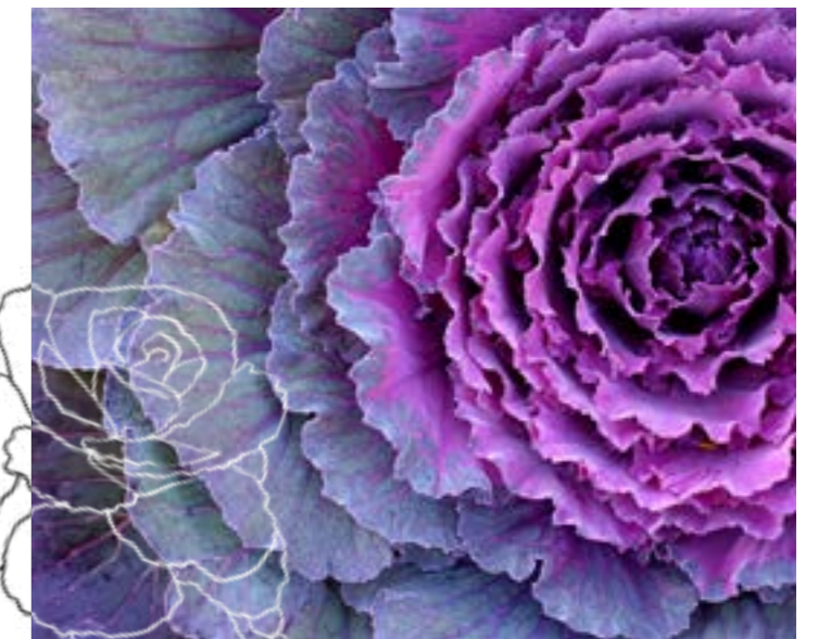
BRASSICA OLERACEA VAR. ACEPHALA

Falko Werner Garten- und Landschaftsbau GALANET-Partner seit 2005 www.falko-werner-galabau.de 05182 9233-88